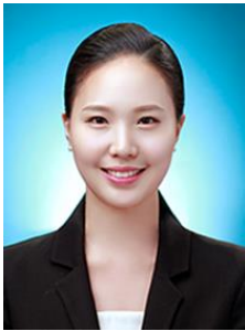
나 지원 관세사